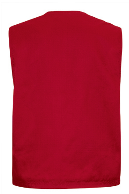
Vista parte trasera de la prenda (espalda)