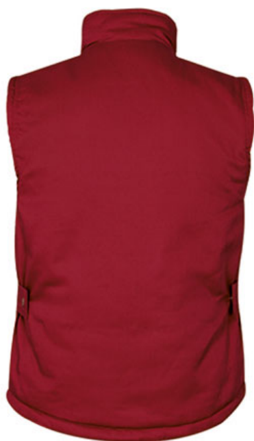
Vista parte trasera de la prenda (espalda)