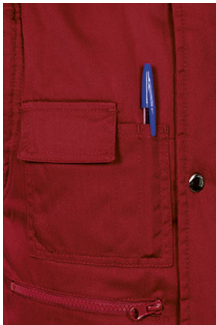
Vista parte trasera de la prenda (espalda)