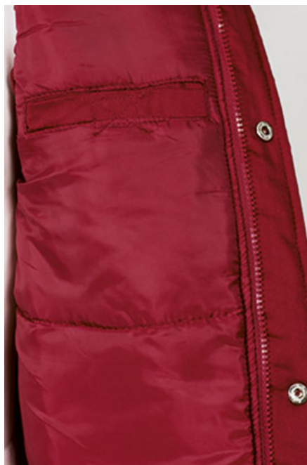
Vista lateral: espalda más larga