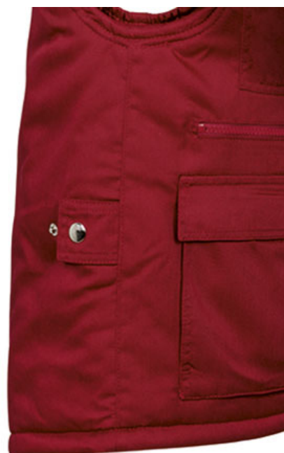
Vista lateral: espalda más larga