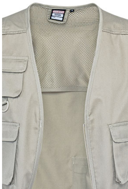
Detalle bolsillo inferior trasero con tapa