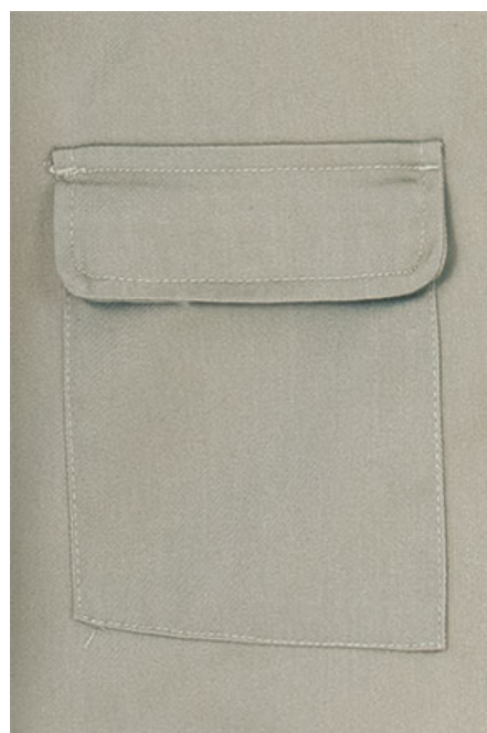
Detalle bolsillo inferior trasero con tapa