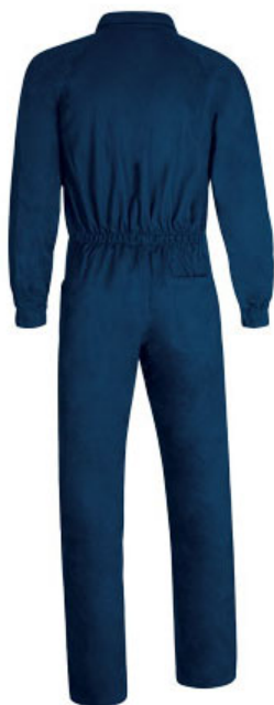
Vista parte trasera de la prenda