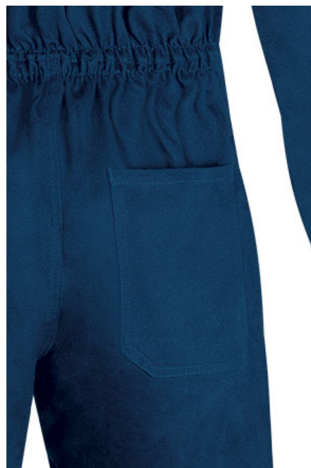
Detalle bolsillo trasero lado derecho