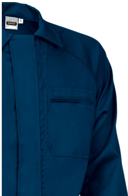
Vista parte trasera de la prenda