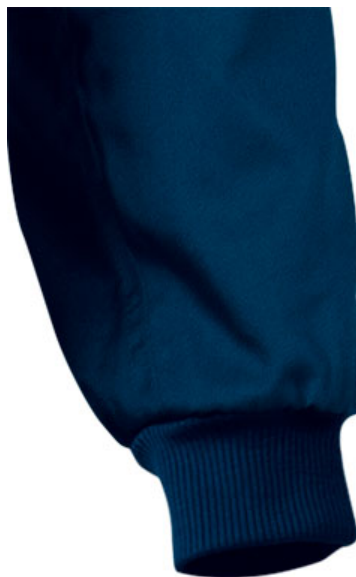
Detalle bolsillo trasero lado derecho