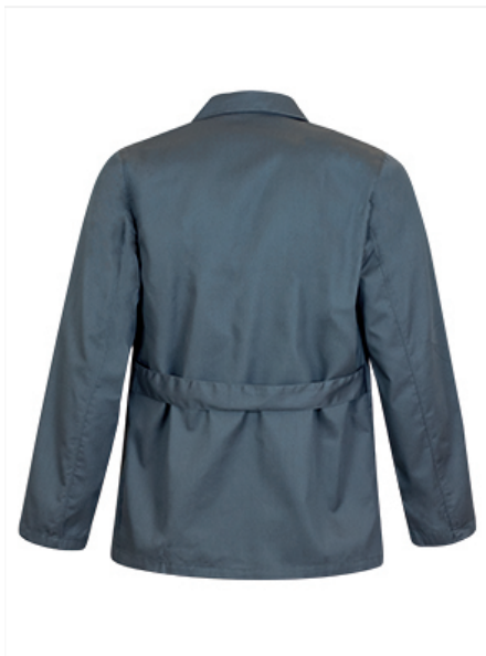
Vista parte trasera de la prenda (espalda)