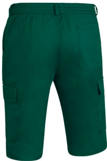
Vista parte traseira da peça