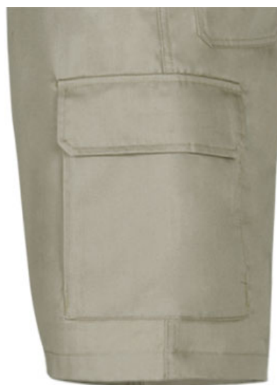
Detalhe bolso lateral