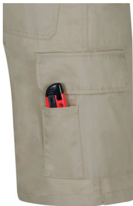
Detalle bolso lateral com compartimento para chisato