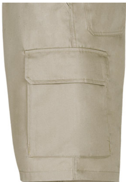
Vista parte traseira da peça