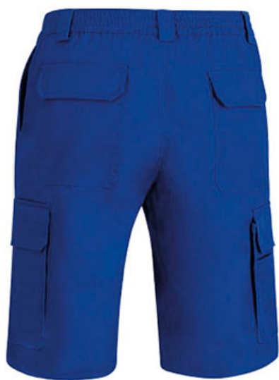
Vista parte traseira da peça