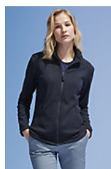
SOL'S NORMAN WOMEN 02094