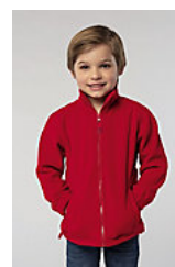
SOL'S NORTH KIDS 00589