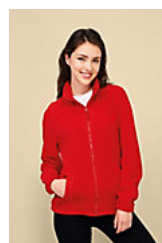
SOL'S NORTH WOMEN 54500