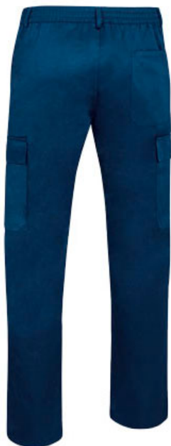
Vista parte traseira da peça