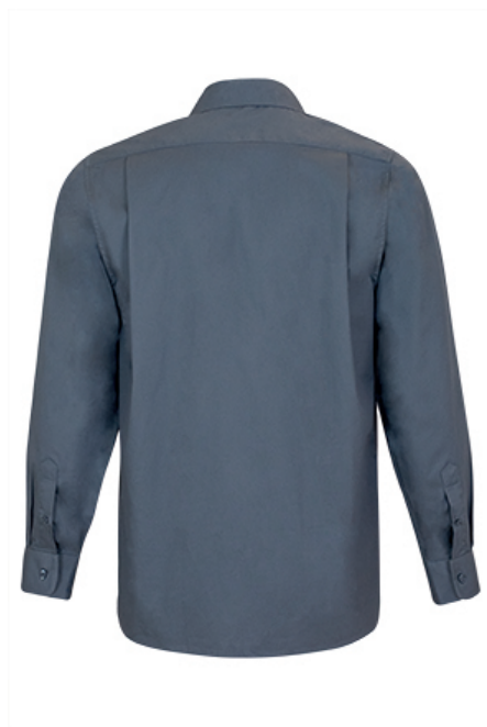
Vista parte traseira da peça (costas)