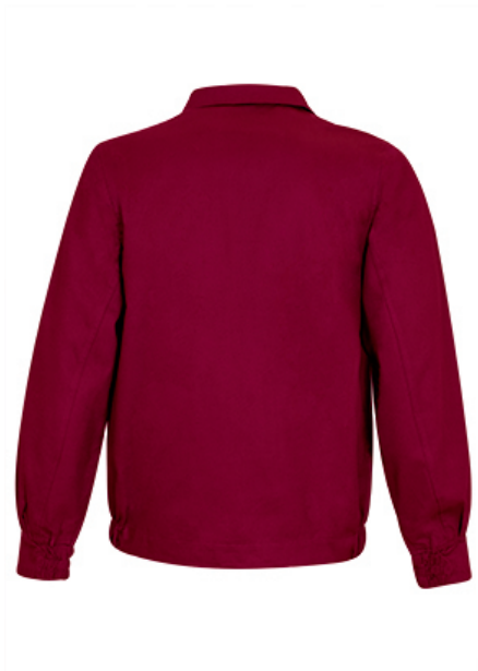
Vista parte traseira da peça (costas)