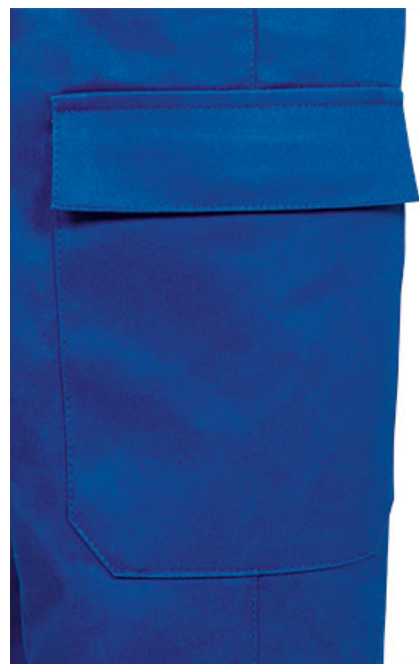
Detalhe bolso lateral