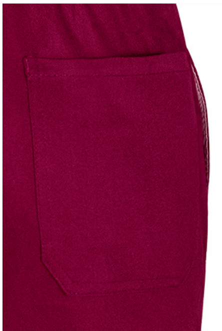
Vista parte traseira da peça