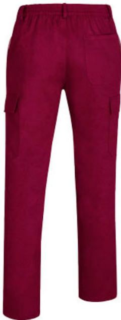
Vista parte traseira da peça