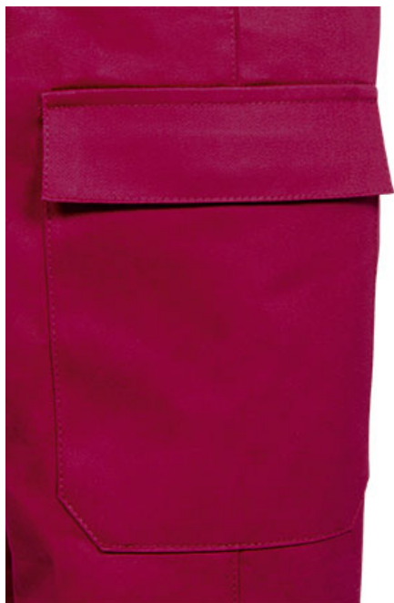
Vista parte traseira da peça