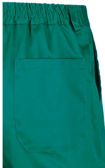
Detalhe bolsos traseiros