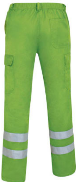
Vista parte traseira da peça