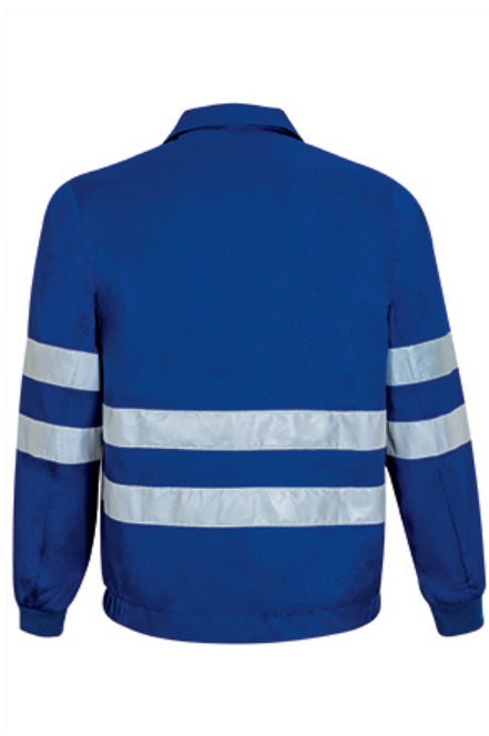
Vista parte traseira da peça (costas)