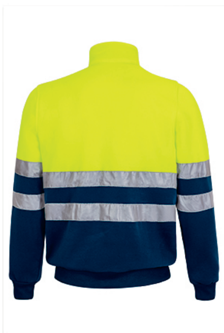
Vista parte traseira da peça (costas)