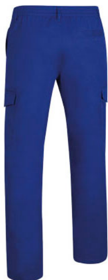
Vista parte traseira da peça