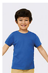
SOL'S REGENT KIDS 11970