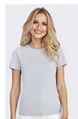
SOL'S REGENT WOMEN 01825