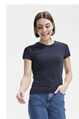
SOL'S MISS 11386