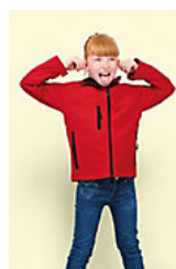
SOL'S REPLAY KIDS 46603