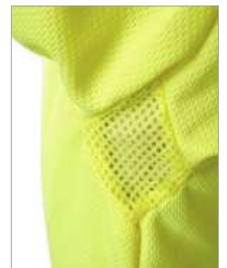
Detalle de las axilas